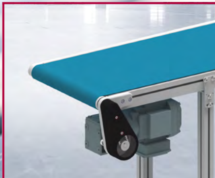
Automation und Fördertechnik