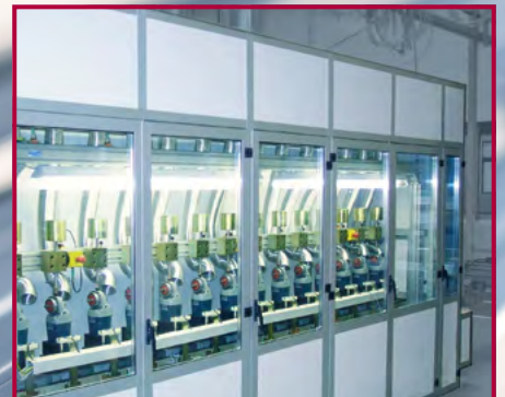
Schutzkabinen und Lärmschutz