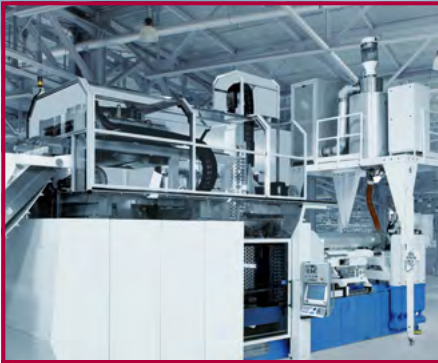
Maschinengestelle und Einhausungen